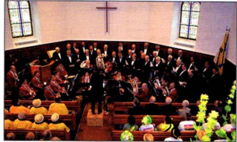
La partie officielle