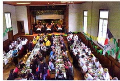
REPAS MÉRITÉ A LA GRANDE SALLE VILLAGEOISE DES CHARBONNIÈRES