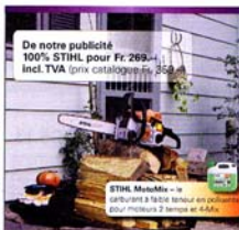
De notre publicité 100% STIHL pour Fr. 269.- Incl. TVA. (prix catalogue) - 30 ans.